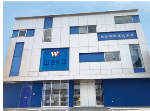
和光製版株式会社 本社社屋