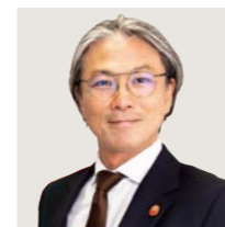
大阪府印刷工業組合 理事長 大興印刷(株) 代表取締役

本年は組合設立70周年を迎えます。引き続き、ご支援・ご協力を賜りますよう、よろしく願い申し上げます。