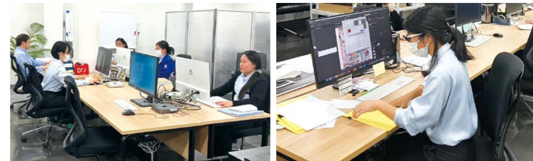
日本人と外国人が同じ職場で垣根なく働いています

に高い日本の賃金です。当時、フィリピンでの月給は約1,500ペソ(約3万円)程度でしたが、日本ではそれを大幅に上回る収入を得ることが可能です。収入の多くは家族への仕送りにあてられ、数年間日本で働き、母国で家を建てるという夢を実現する社員も少なくありません。さらに、日本の治安の良さや親切な人々も、学生たちにとって大きな魅力であり、他国ではなく日本を選ぶ理由には、こうした安心感や温かさが深く関係しているようです。