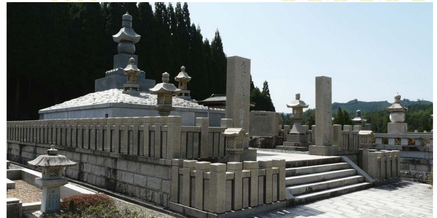
1973年に建立された「印刷産業人物故者納骨塔」

高野山印刷産業人納骨塔奉讃会事務局 大阪市都島区中野町4-4-2 〒534-0027 (大阪府印刷工業組合内) 電話(06)6353-3035 FAX(06)6352-2360