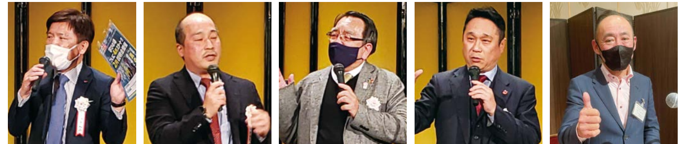
伊東経営トランスフォーム委員長 高本事業承継委員長 溝口地域共生委員長 福山広報渉外委員長 池下理事