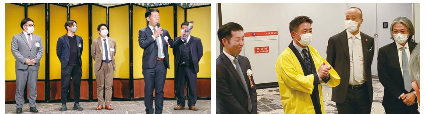
西岡大阪青年印刷人協議会議長